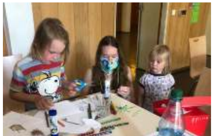
Basteln am Familientisch

Da auch die Sommerreise für Kinder in diesem Jahr ausfallen musste, boten unsere Gemeinde und die Luthergemeinde in Gemeinschaftsarbeit den Kindern ein Sommerferienprogramm an, das von einer kleinen Kinderschar gern angenommen wurde. Wir hatten viel Spaß beim Thema „Märchensommer“, bestes Wetter und einen traumhaften Betreuungsschlüssel (11 Kinder und 3 Betreuer – davon träumt jede Kita).