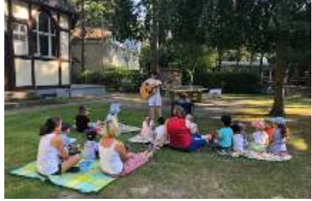
Mini-Gottesdienst open air

Mit dem neuen Kita-Jahr starteten auch die Minigottes-