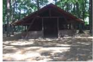
Unser „Stall“ in Wichern

In diesem Jahr werden wir das Weihnachtsfest draußen am Stall in Wichern und an der Krippe im Radeland feiern.