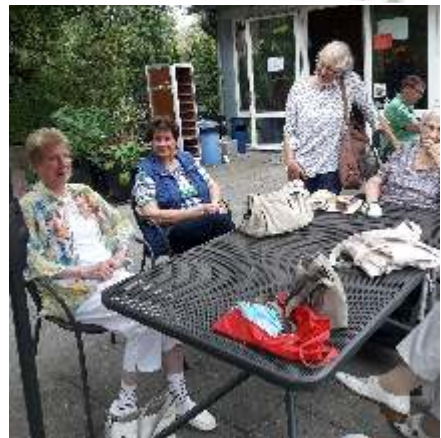
Im Café Gartenlaube

Am 18. Juni kamen wir in einem Restaurant zum Mittagessen zusam-